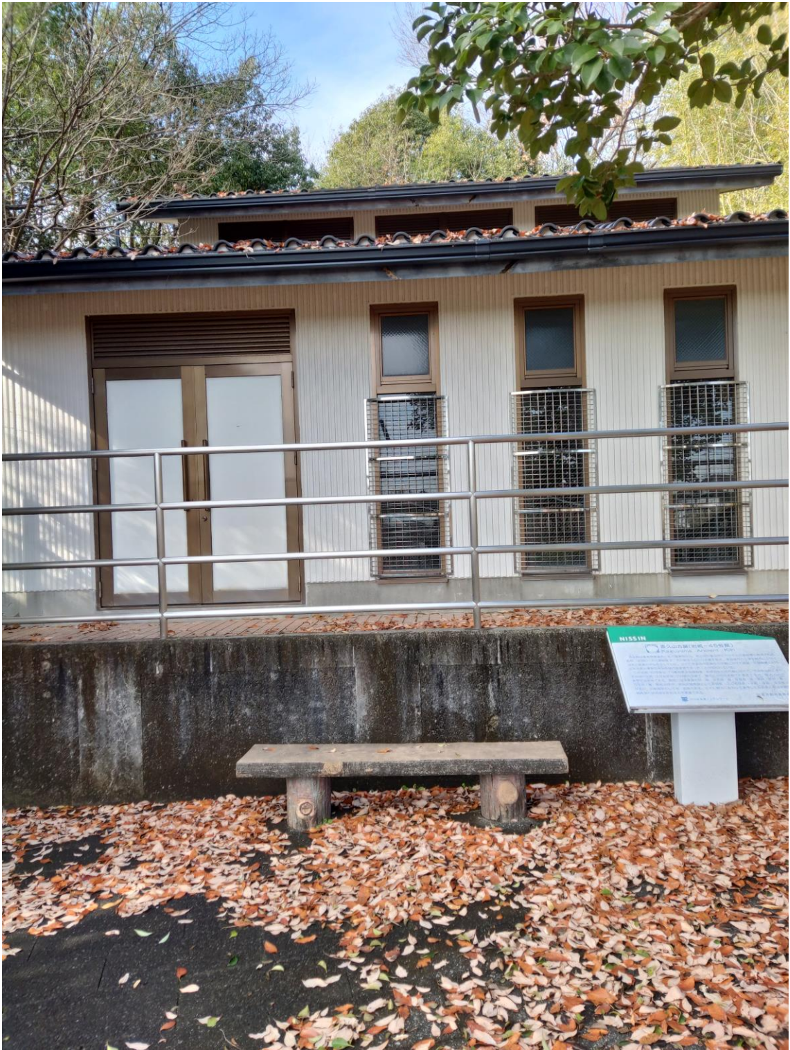
日進市 香久山古窯 (岩崎45号窯)