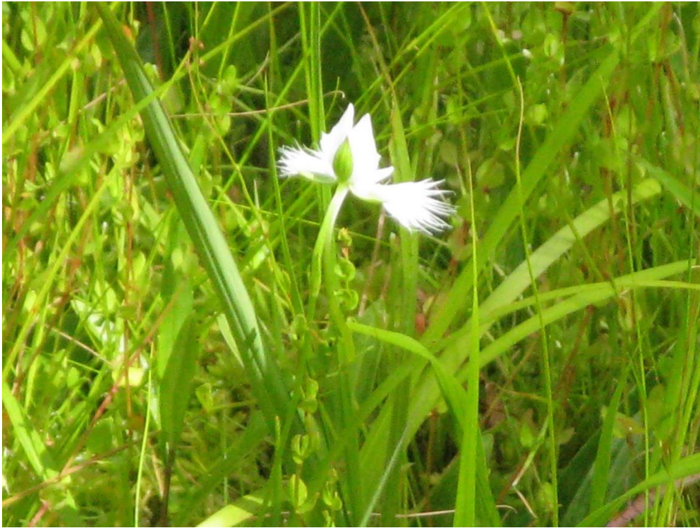
島田緑地 サギソウ