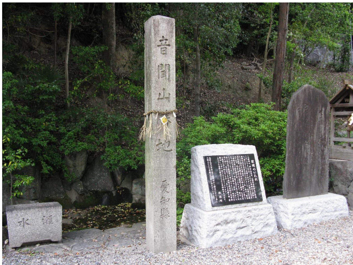
八事神社 音聞山勝地の碑

八事の「音聞山」は海の波の音を聞ける名所ということで、平安時代には歌枕になりました。