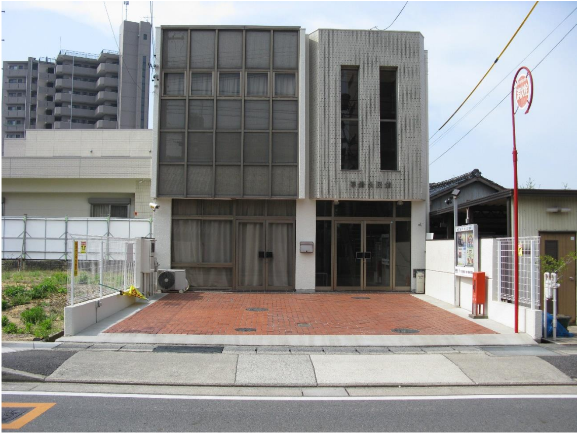
平針宿本陣跡 現平針旧公民館