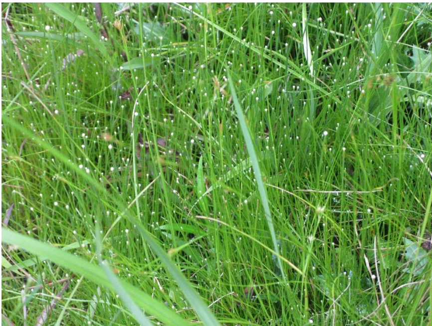
島田緑地 シラタマホシクサ