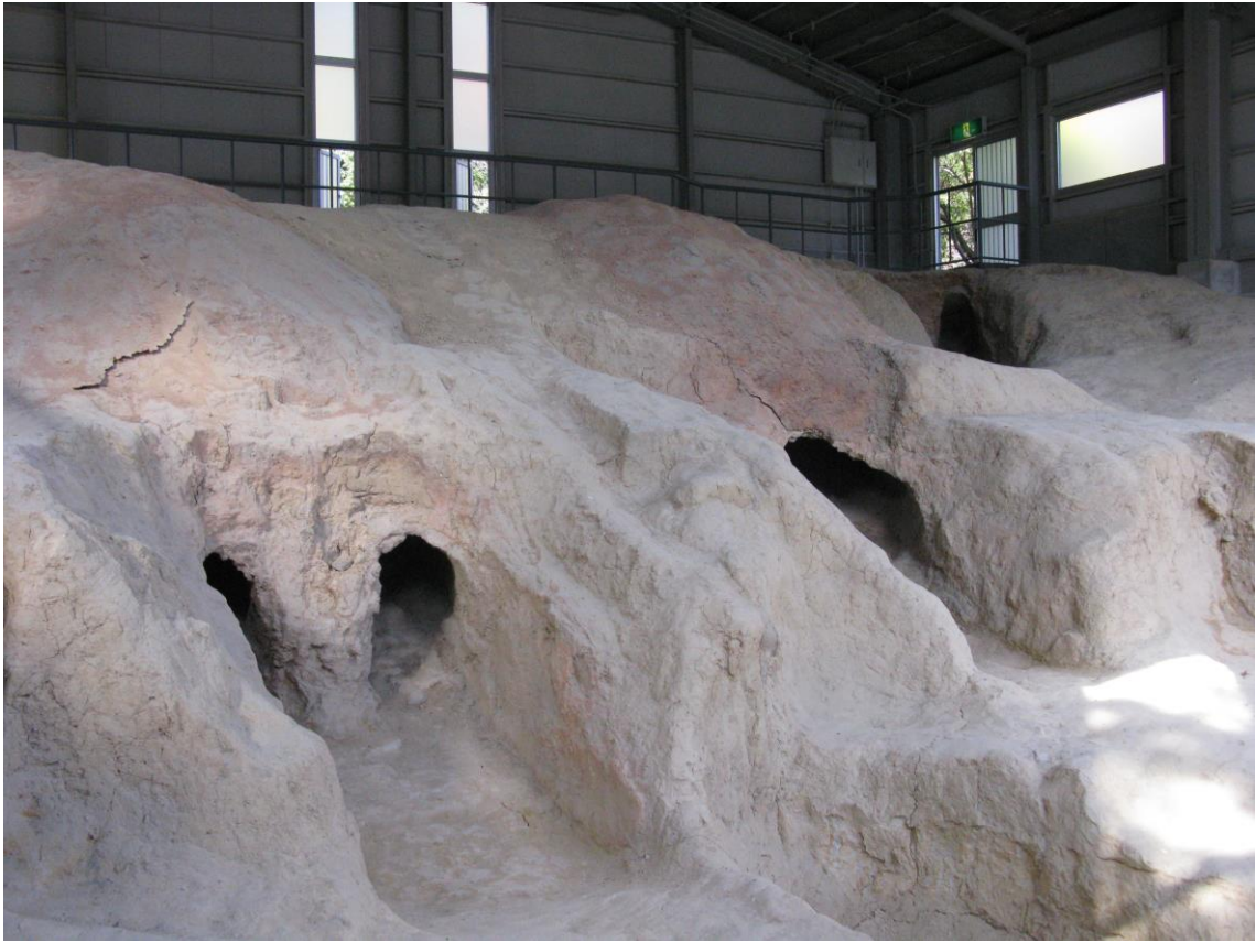
瀬戸市 愛知県陶磁美術館 南山9号窯 (平安時代)